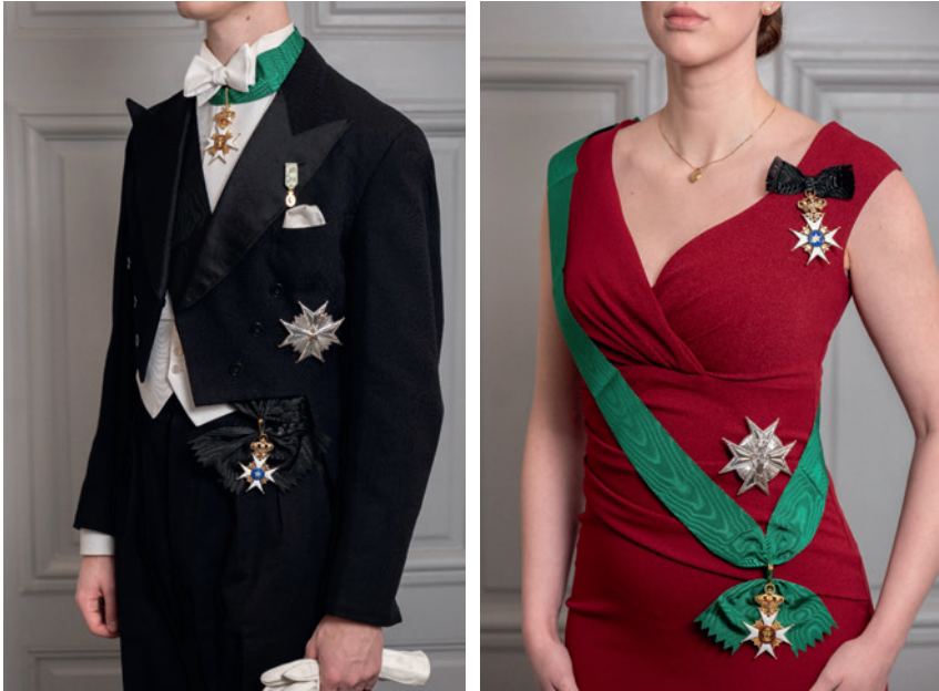
Fig. 2. Storkorsband från axel till höft.

Storkors bärs för herrar över höger axel ( en écharpe ) under frackrocken men över västen. Bandets längd anpassas så att knuten/rosetten kommer strax under kanten av framstycket, tillfälligtvis med en vikning låst med säkerhetsnål vid axeln, mer permanent genom att bandet kapas något vinklat nedåt mot halssidan och sys ihop.