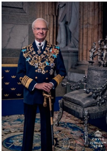
Fig. 1. H.M. Konungen med ordenskedjor.

I normalfall bärs storkors i band, även om kedja utdelats. Bärande av ordenskedja föreskrivs särskilt. Då kedja är föreskriven bärs inte samma storkors i axelband, men ett annat utländskt storkors i axelband kan bäras.