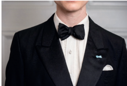
Fig. 7. Medaljrosett i knapphålet för herre.