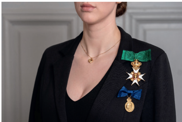
Fig. 10. Kommandörstecken i stor rosett vid axeln och bröstutmärkelse i rosett till kavaj för dam.

Damer kan bära dessa i dubbelvikta band, se ovan. Miniaturer bärs inte klänning m.m. motsvarande kavaj.