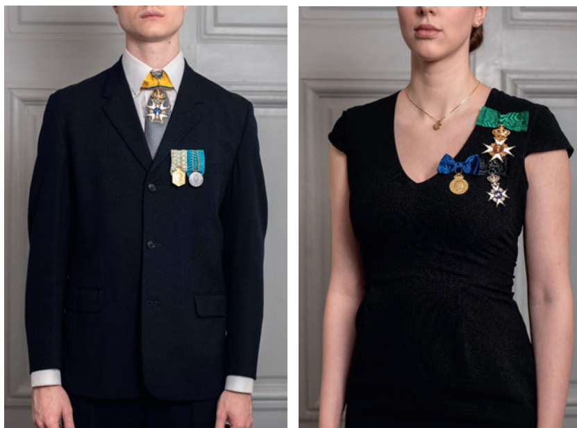
Fig. 9. Kommendörstecken om halsen för herre samt bröstutmärkelser i originalstorlek. Kommendörstecken i stor rosett vid axeln och bröstutmärkelser i rosett.

Till mörk kavaj bärs i samband med militära högtidligheter m.m. endast ett utmärkelsetecken om halsen. Utmärkelsens bandögla vilar på slipsens knut och bandet går under den nedvikta skjortkragen.