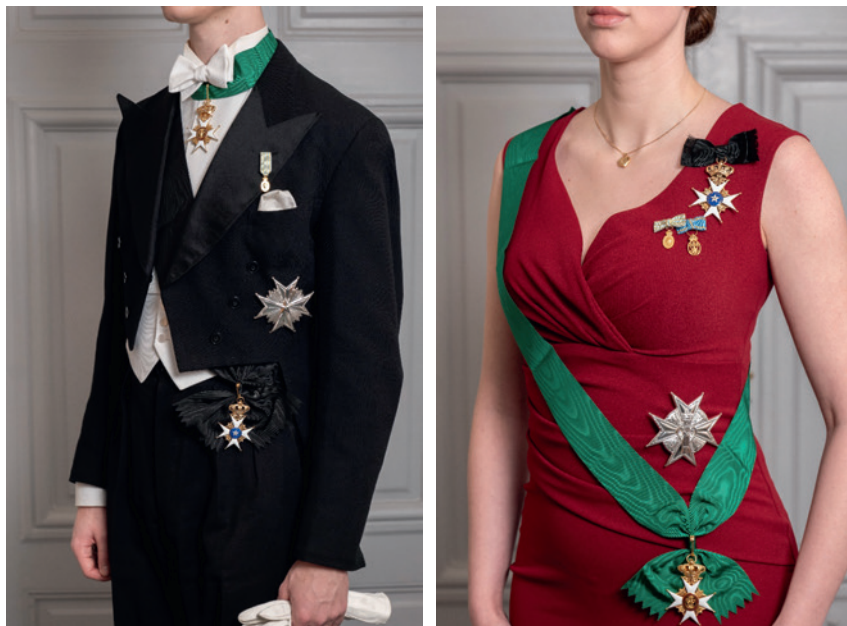
Fig. 3. Kommendörstecken om halsen på herre och i stor rosett på dam.

För herrar ska bandet vara så kortat att bäröglan kommer omedelbart under rosettens knut. Bandet ligger på skjortkragen samt rosettens band och fästs i nacken så dess fästansordningar inte syns ovanför frackens krage. Högst tre utmärkelser i band om halsen bärs samtidigt.