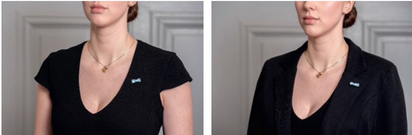
Fig. 8. Medaljrosett på klänning och jacka för dam.

Till mörk kavaj (=svart, mörkt blå eller mörkt grå kostym) kan en ordensknapp, clips eller rosett i knapphålet ange innehav av utmärkelse till vardag eller festligare sammanhang.