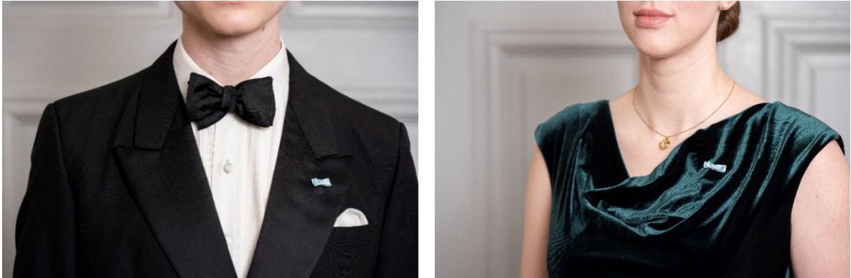
Fig. 5. Medaljrosett i knappålet för herre och på klänning för dam.

Till smoking kan i första hand en ordensknapp, clips eller rosett i knappålet ange innehav av utmärkelse.