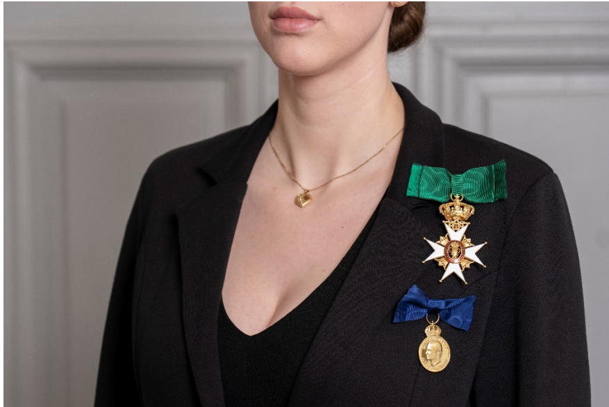
Fig. 10. Kommendörstecken som stor rosett vid axeln och bröstutmärkelse i rosett till kavaj för dam.

Damer kan bära dessa i dubbelvikta band, se ovan. Miniaturer bärs inte klänning m.m. motsvarande kavaj.