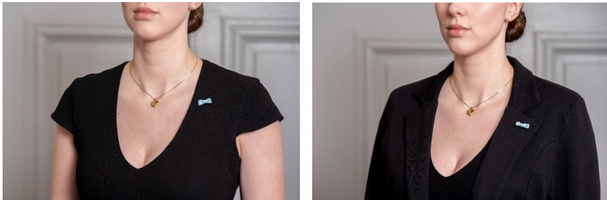
Fig. 8. Medaljrosett på klänning och jacka för dam.

Till mörk kavaj (=svart, mörkt blå eller mörkt grå kostym) kan en ordensknapp, clips eller rosett i knapphålet ange innehav av utmärkelse till vardag eller festligare sammanhang.