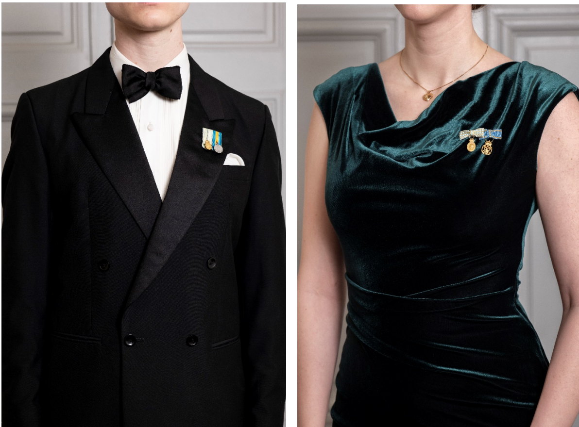
Fig. 6. Miniatyr i knappålet på herre och miniatyrrosetter på dam.

Till knälång eller vadlång klänning till smoking placeras rosetten som om den hade suttit på en kavaj.