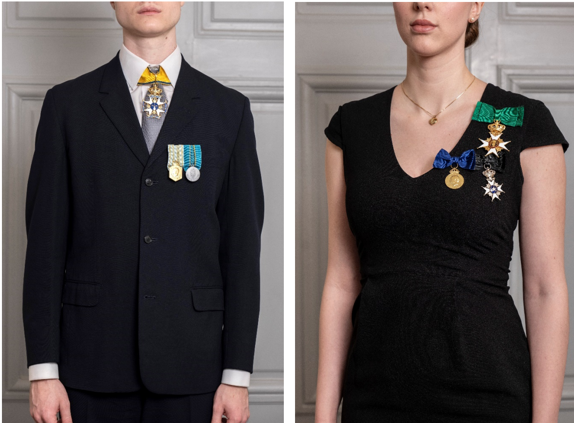
Fig. 9. Kommendörstecken om halsen för herre samt bröstutmärkelser i originalstorlek. Kommendörstecken som stor rosett vid axeln och bröstutmärkelser i rosett.

Till mörk kavaj bärs i samband med militära högtidligheter m.m. endast ett utmärkelsetecken om halsen. Utmärkelsens bandögla vilar på slipsens knut och bandet går under den nedvikta skjortkragen.