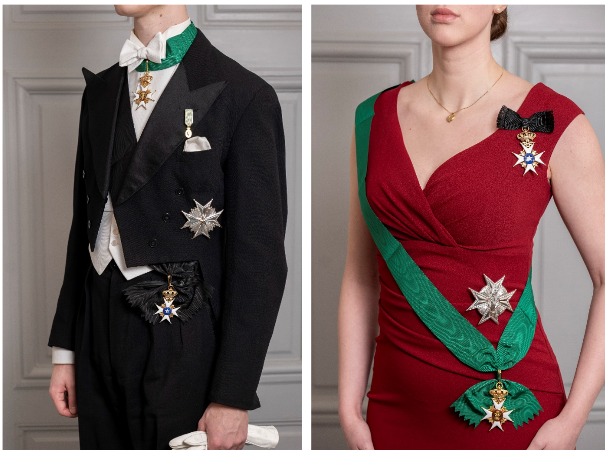
Fig. 2. Storkorsband från axel till höft.

Storkors bärs för herrar över höger axel ( en écharpe ) under frackrocken men över västen. Bandets längd anpassas så att knuten/rosetten kommer strax under kanten av framstycket, tillfälligtvis med en vikning låst med säkerhetsnål vid axeln, mer permanent genom att bandet kapas något vinklat nedåt mot halssidan och sys ihop.